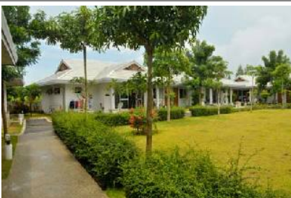
Garten mit Bungalows